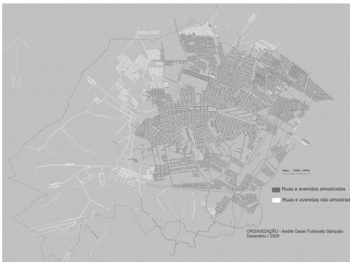
Figura 01 – Cidade de Maringá e a estimativa das ruas e avenidas amostradas pelo inventário.

Milano (1988), considerando uma precisão de amostragem de 95% de probabilidade e com limite de erro de 10%, efetuou amostragem aleatória com 15 unidades amostrais de 200 x 500 metros, distribuídas por toda zona urbana de Maringá, inventariou no total mais de 3 mil árvores, que representaram 5% da população de árvores de vias públicas da época. A amostragem realizada por esta pesquisa amostrou aproximadamente 90% da população de árvores da cidade, amostrando mais árvores do que a população inteira estimada de 1988 (62.818 árvores), ou seja, a significância amostral foi considerada representativa da realidade da arborização urbana de Maringá-PR.